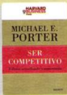
Ser competitivo Michael E. Porter