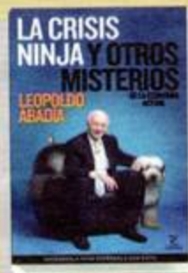
La crisis ninja y otros misterios... Leopoldo Abadía /// EDITORIAL ESPAS